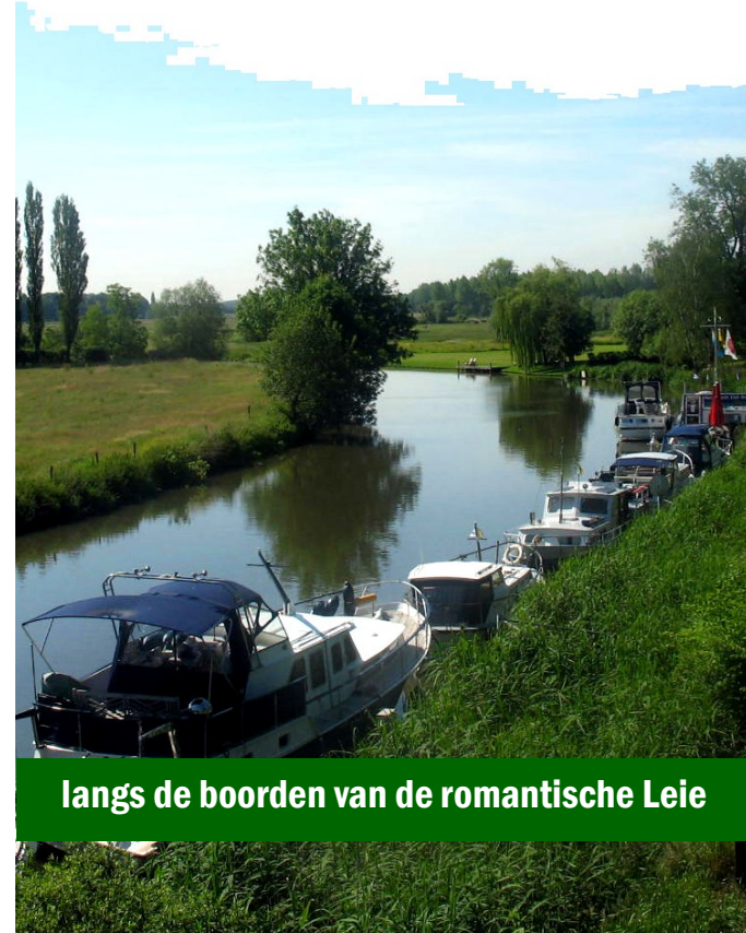
langs de boorden van de romantische Leie